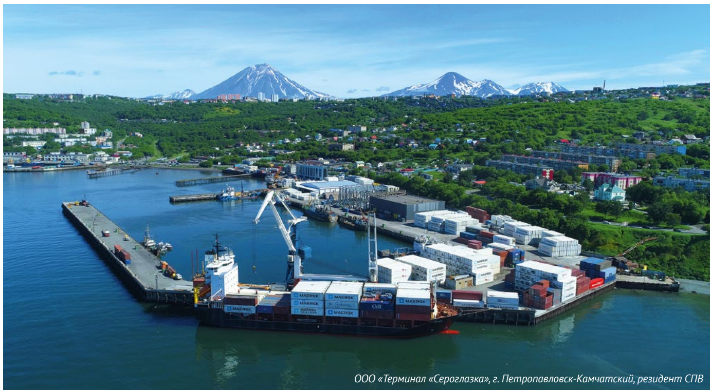
ООО «Терминал «Сероглазка», г. Петропавловск-Камчатский, резидент СПВ

на получение статуса, разработать бизнес-план и финансовую модель. В этом году делаем это уже через собственный интернет-ресурс, что удобно для предпринимателей. Инвестор со своего компьютера вносит данные проекта в информационные окна на сайте в разделе «Стать резидентом», а программа сама рассчитывает бизнес-план, формирует заявку и отправляет на обработку. В течение 15 дней мы выносим решение о присвоении статуса и закрепляем за проектом персонального менеджера. И все это совершенно бесплатно. Впоследствии управляющая компания осуществляет контроль за реализацией соглашений об инвестиционной деятельности, обеспечиваем информационный обмен между заинтересованными государственными органами.