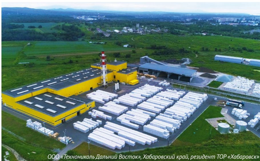
ООО «Техноколь Дальний Восток», Хабаровский край, резидент ТОР «Хабаровск»